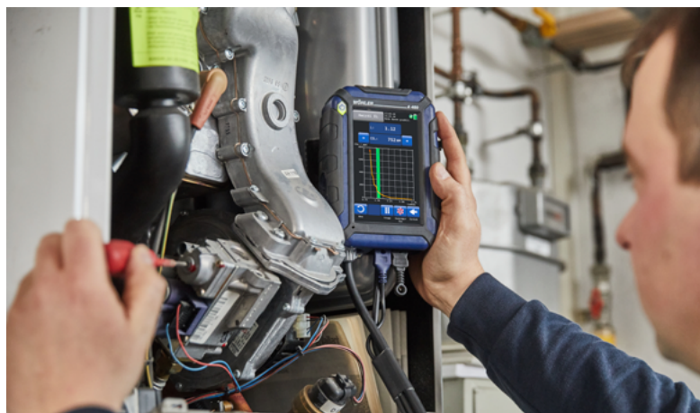
Ajuste rápido y seguro del valor lambda.