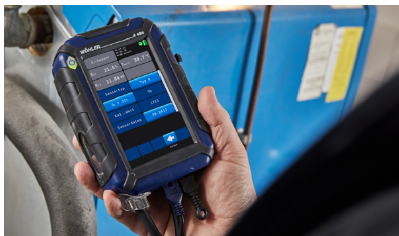
Pantalla grande con todos los valores medidos y calculados - manejo sencillo mediante pantalla táctil - navegación por menús.